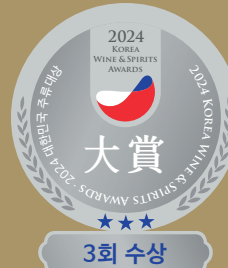
<다회차 수상 스티커 제공>