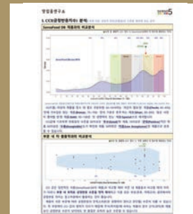
<주류 리포트>