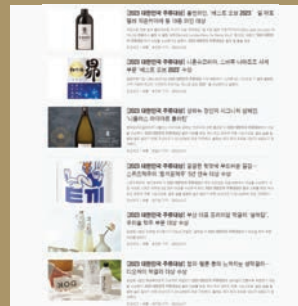
<수상업체 관련 기사>